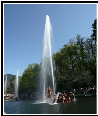
Baños de Diana

– El Mar: este estanque está situado a 1249 m de altitud y abastece de agua a las fuentes